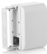
équerre murale en U