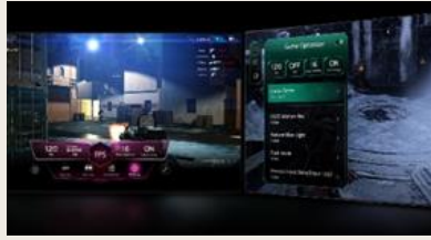
TABLEAU DE BORD & OPTIMISEUR DE JEU

L' intelligence artificielle s'invite dans votre interface webOS. Avec LG ThinQ , commandez votre téléviseur à la voix, que ce soit pour trouver votre prochain contenu à regarder en fonction de vos goûts, pour contrôler les objets connectés de votre foyer ou encore pour faire une requête à votre AI ChatBot .