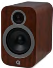
QA3532 - Noyer anglais