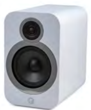
QA3538 - Blanc arctique

Le modèle 3030i est la dernière nouveauté à faire son apparition au sein de la gamme Q Acoustics 3000i déjà multi-recompensée ! Conçu pour fournir un son puissant et une dynamique auparavant jamais atteinte par un haut-parleur de ce type et de ce prix, 3030i est doté d'un haut-parleur médium / grave de 165 mm développé à partir de la très performante 3050i, ainsi que d'un aimant optimisé. 3030i permet également une extension et un contrôle des graves bien supérieurs à ceux offertes par ses concurrents directs. En utilisant également le même type de tweeter ainsi qu'un montage identique à celui utilisé pour les 3050i, 3030i redéfinit la Haute Fidélité et l'ampleur de la restitution pour un modèle sur pieds et à prix compétitif.