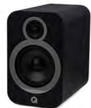
QA3536 - Noir carbone