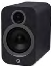
QA3530 - Gris graphite