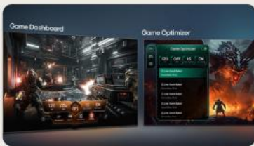
TABLEAU DE BORD & OPTIMISEUR DE JEU

L' intelligence artificielle s'invite dans votre interface webOS. Avec LG ThinQ , commandez votre téléviseur à la voix, que ce soit pour trouver votre prochain contenu à regarder en fonction de vos goûts, pour contrôler les objets connectés de votre foyer ou encore pour faire une requête à votre AI ChatBot .