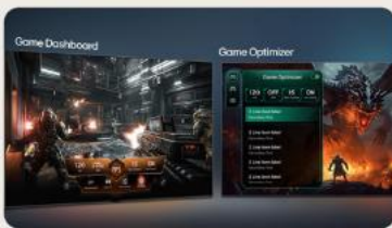
TABLEAU DE BORD & OPTIMISEUR DE JEU

L' intelligence artificielle s'invite dans votre interface webOS. Avec LG ThinQ , commandez votre téléviseur à la voix, que ce soit pour trouver votre prochain contenu à regarder en fonction de vos goûts, pour contrôler les objets connectés de votre foyer ou encore pour faire une requête à votre AI ChatBot .