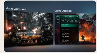
TABLEAU DE BORD & OPTIMISEUR DE JEU

L' intelligence artificielle s'invite dans votre interface webOS. Avec LG ThinQ , commandez votre téléviseur à la voix, que ce soit pour trouver votre prochain contenu à regarder en fonction de vos goûts, pour contrôler les objets connectés de votre foyer ou encore pour faire une requête à votre AI ChatBot .